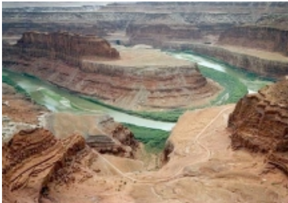
Deadhorse Statepark bei Moab

Durch eine abwechslungsreiche Landschaft geht es zurück in den Staate Utah nach Moab, dem Ausgangspunkt zum Arches NP und Canyonlands NP . Übern. im Hotel Ramada Inn Moab.