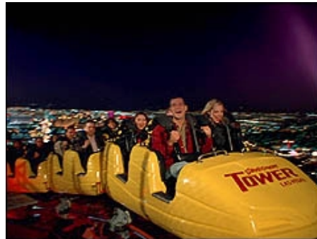
Die höchste Achterbahn on Top des Stratosphere Towers

Durch die Mojawewüste geht die Fahrt auf dem Highway direkt nach Las Vegas; 2 Übern. im beliebten Hotel Circus Circus *** am Las Vegas Blvd. oder Hotel Best Western Mardi Gras ***