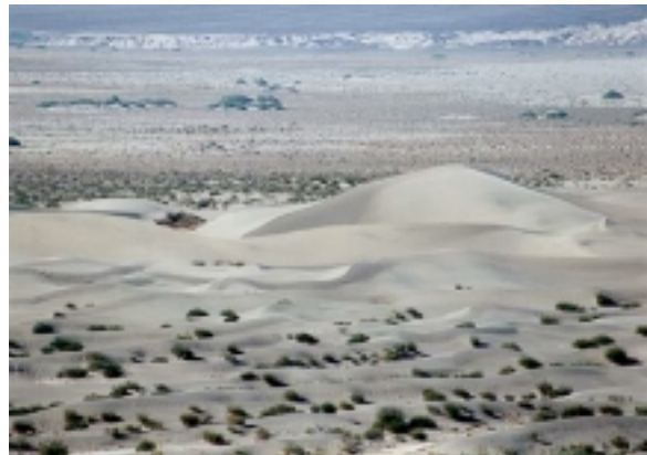
Sanddünen im Death Valley