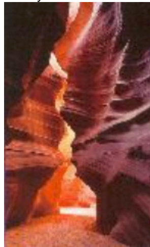
Antelope Canyon bei Page

5.Tag Grand Canyon – Page 230 km Am Grand Canyon Southrim entlang zur Little Colorade Schlucht. Die weitere Strecke durch Navajo Indianerland nach Page ist abwechslungsreich und interessant. Übern. im Courtyard Hotel in zentraler Lage im Ort Page.