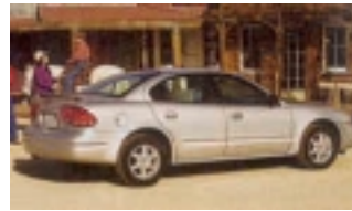
Midsize: Fahrzeug der Mittelklasse etwa vergleichbar mit Opel Vectra. Gut geeignet für 2 Personen mit Gepäck

Unterkunft: in guten Mittelklassehotels in touristisch guter Lage und in Nationalparks; alle Zimmer mit Bad/WC, TV, Telefon und Klimaanlage Auto: Mietwagen „All Inklusiv“ mit unbegr. Meilen, CDW Haftpflichtvers. ohne Selbstanteil des Mieters, Zusatzhaftpflichtversicherung 1,5 Mio € 1. Tankfüllung, alle Zusatzfahrer über 25 Jahren, Personen- Insassenversicherung, Gepäckversicherung (ausg. an New York). Für Fahrer 21-25 Jahren ist am Ort eine Zusatzversicherung abzuschließen (20$/Tag) . Soweit mehrere Fahrten zw. 21 und 25 Jahre sind empfehlen wir unseren Tarif „Under 25“ der etwa 5€/jeTag höher ist, aber dann günstiger als die am Ort zu zahlenden Versicherung.