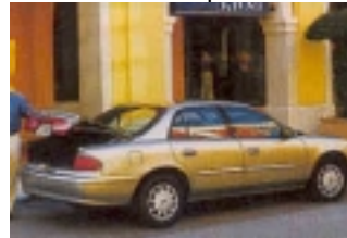
Fullsize: Fahrzeug der gehobenen Mittelklasse etwa vergleichbar mit Opel Omega. Gut geeignet für 2 Erw. und 2 Kinder mit Gepäck