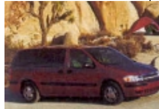
MiniVan: 7-Sitzer, ideal für 4 Erwachsene mit Gepäck, vergleichbar mit Opel Zafira

Alle Fahrzeuge haben autom. Getriebe, Klimaanlage, Servobremsen und Servolenkung, Radio, CD-Player. Wir vermitteln Fahrzeuge renommierter Vermietunternehmen wie z.B. Alamo, Budget, National, Avis, Hertz. Sollten Sie einen bestimmten Vermieter wünschen, geben Sie dies bitte bei Ihrer Anfrage an.