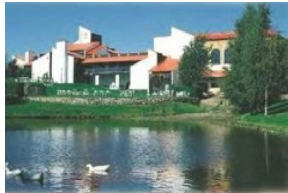
2 Übern. Hotel Cheribough

Von Montreal geht es zuerst in südlicher Richtung zum Lake Champlain und nach einem kurzen Abstecher in die USA und durch den Staat Vermont wieder zurück nach Kanada, um den kleinen Ort Orford.