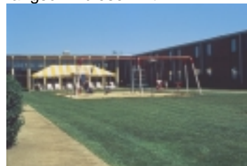
Übern. im Best Western Sovereign Hotel

Durch die Berkshires geht es nach Süden durch den kleinen Bundesstaat Connecticut bis zur Atlantikküste, nach Mystic. Früher wurden hier die großen Dreimaster gebaut. Heute ist Mystic ein Art Museumsstädtchen mit einer hübschen Altstadt, chicen – wenn auch teuren – Geschäften und dem Mystic Seaport. Entlang dem Ufer stehen die restaurierten Fischerhäuser, in einer Museumswerft kann man den Bau von Segelschiffen beobachten und der Stolz ist der aus dem Jahr 1841 stammende Dreimaster, das letzte noch erhaltene Walfangschiff dieser Art.