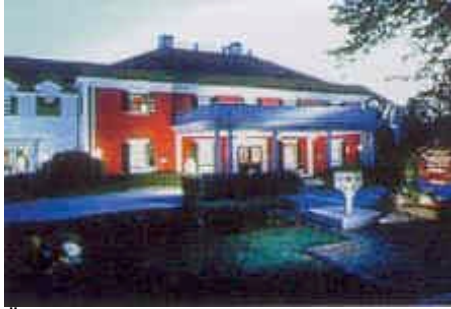
Übern. Im Dan L'Webster Inn