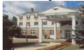
Williams Inn Williamstown

Am malerischen Lake George entlang führt die heutige Etappe in den nordwestl. Zipfel von Massachusetts, in die wunderschönen Berkshire Mountains, nach Williamstown Hotel The Williams Inn. Im Sommer finden in den Berkshire Mtns. Musikfestivals großer Orchester statt.