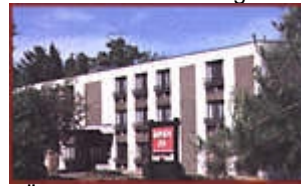
Übern. im Summit Hotel Lake Placid.

Adirondack Mountains, in den Wintersportort Lake Placid. Der frühere Olympiort ist umgeben von bis zu 1600m hohen Bergen.