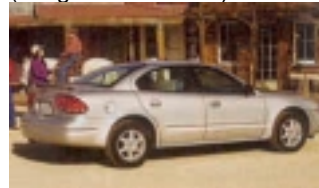
Midsize: Fahrzeug der Mittelklasse etwa vergleichbar mit Opel Vectra. Gut geeignet für 2 Personen mit Gepäck