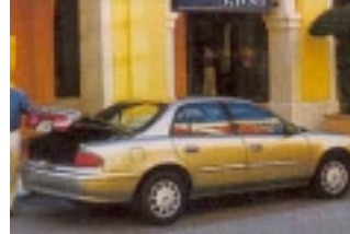
Fullsize: Fahrzeug der gehobenen Mittelklasse etwa vergleichbar mit Opel Omega. Gut geeignet für 2 Erw. und 2 Kinder mit Gepäck