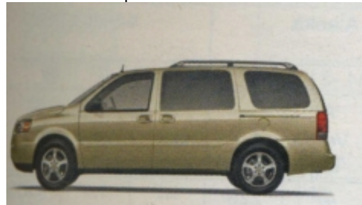
MiniVan: 7-Sitzer , ideal für 4 Erwachsene mit Gepäck, vergleichbar mit Opel Zafira

Alle Fahrzeuge haben autom. Getriebe, Klimaanlage, Servo-bremsen und Servolenkung, Radio, CD-Player. Wir vermitteln Fahrzeuge renommierter Vermietunternehmen wie z.B. Alamo, Budget, National, Avis, Hertz. Sollten Sie einen bestimmten Vermieter wünschen, geben Sie dies bitte bei Ihrer Anfrage an.