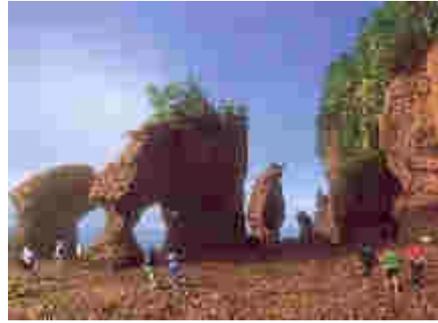
im Fundy National Park

Es geht an der Bay of Fundy entlang, wo Sie die höchsten Tidenunterschiede von bis zu 12 m erleben können. Moncton ist die Hauptstadt der Provinz New Brunswick. Übern. Hampton Inn