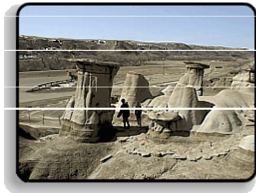
Hoodoos bei Drumheller

Durch den Süden der Provinz Alberta, einem landwirtschaftlich genutzten Gebiet kommen Sie zum Dinosaur Provinzpark. Die Landschaft hier könnte auch auf einem anderen Planeten liegen, so fremd wirkt sie. Hier wurden zahlreiche Dinosaurierskelette gefunden. Auf Lehrpfaden lernt man mehr aus der Zeit der Riesenechsen kennen.