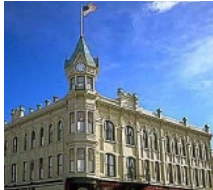
Geiser Grand Hotel (Restaurant, Cafe, Saloon) on Baker City

Da die Tagestrecke recht kurz ist, kann man auch noch einen Abstecher zum Hells Canyon unternehmen. Sie wohnen in dem historischen