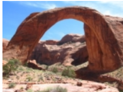
Rainbow Bridge am Lake Powell

6.Tag Lake Powell Heute besteht die Möglichkeit zu einer schönen Schiffstour auf dem lake Powell zur Rainbow Bridge.