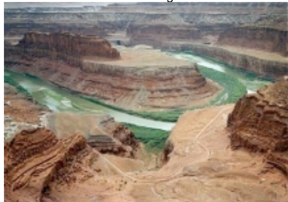
Deadhorse Statepark bei Moab

2 Übern. Hotel Big Horn Lodge in Moab. (SUP: Red Cliff Lodge) Am Nachmittag haben Sie Zeit für die Besichtigung des Arches NP mit seinen beeindruckenden Felsenbögen.