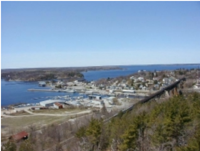
Blick auf Parry Sound

Parry , am Ostufer des Lake Huron, ist ein kleiner Ferienort und Ausgangspunkt in eine einzigartige Inselwelt, die man unbedingt auf einer Schiffstour entdecken muss. Die „Island Queen“ fährt 3 Std. durch eine atemberaubende Insellandschaft, durch enge Kanäle und vorbei an malerischen Buchten. Parry Island ist ein Reservat der Huronen Indianer. Übern. Hotel Comfort Inn